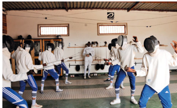
Séance d'escrime, animée par une surveillante pénitentiaire, F.Sy. © Association Pour le Sourire d'un Enfant.