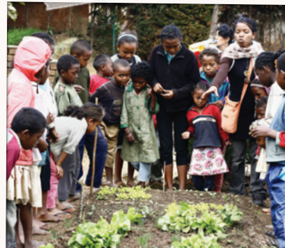
UN CENTRE DE FORMATION AGRICOLE PROPOSE DES VISITES ORGANISÉES ET DES CLASSES DE DÉCOUVERTE SUR SON SITE, ASSOCIATION EAU DE COCO, MADAGASCAR.

Dans le cadre de microprojets de solidarité internationale avec un objectif social de production d'un bien ou d'un service par les bénéficiaires, une partie de la production peut être affectée à la vente afin de dégager des ressources financières.