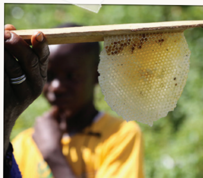
APPUI À LA MODERNISATION ET AU DÉVELOPPEMENT DE L'APICULTURE, ASSOCIATION NORMANDIE GUINÉE, GUINÉE.

Il s'agit à ce stade d'un véritable projet de micro-entreprise. L'activité qui va générer des revenus n'a rien à voir avec l'activité sociale et nécessite des moyens et une organisation particulière.