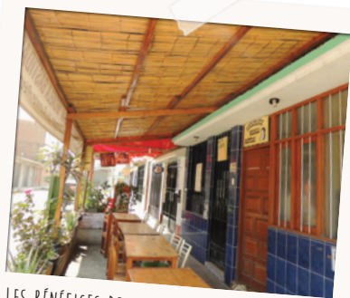
LES BÉNÉFICES DE CE RESTAURANT D'INSERTION PERMETTENT DE PAYER LE SALAIRE DE TROIS EMPLOYÉS.

« Limiter autant que possible les charges au lancement de l'activité. Il faut faire des investissements à hauteur de l'activité, penser à la qualité du produit et ne pas faire de dépenses inutiles ».