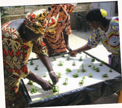
FORMATION DE FEMMES EN MARAÎCHAGE ET VENTE D'UNE PARTIE DE LA PRODUCTION, ASSOCIATION SHUKALI, SÉNÉGAL.

Il existe différents types d'activités génératrices de revenus, qui reflètent une logique entrepreneuriale plus ou moins forte :