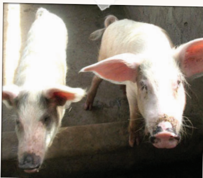
CONSTRUCTION D'UNE PORCHERIE POUR COUVRIR LES FRAIS DE FONCTIONNEMENT D'UNE ÉCOLE, ASSOCIATION SOS POUR L'AFRIQUE, BURKINA FASO.

Dans le cadre d'un microprojet, les investissements et le matériel acquis peuvent être utilisés pour réaliser une activité qui génère des revenus.