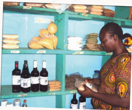
VENTE DE PRODUITS DANS UNE BOUTIQUE ANNEXE D'UN CENTRE DE FORMATION, ASSOCIATION PEUPLE SOLIDAIRES SAINT-LÔ, BURKINA FASO.

► IMPORTANT : L'appellation « étude de marché » peut intimider ceux qui, ne se sentant pas suffisamment compétents, préféreront éviter ou négliger cette étape. Or, une étude de marché reste avant tout une affaire de méthode et de bon sens !