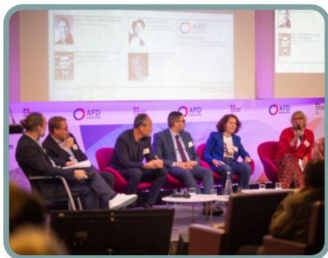
Les intervenants de la table ronde

Les intervenants ont souligné le potentiel du sport comme moteur d'innovation sociale après les Jeux Olympiques de Paris 2024. Il est perçu comme un outil puissant pour promouvoir l'égalité des genres, soutenir l'éducation et l'insertion professionnelle, notamment par la transmission de valeur, de soft skills, et en faisant tomber les barrières sociales. Il permet aussi de favoriser l'impact social à grande échelle grâce à des financements innovants et des partenariats renforcés. Certains acteurs ont d'ailleurs rappelé l'importance des coalitions de bailleurs de fonds et l'opportunité que constituent les acteurs du secteur privé comme les fondations ou les entreprises.